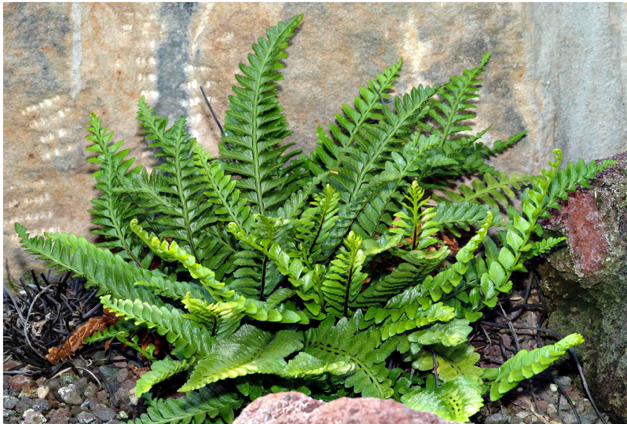
Bild 2. Nordischer Streifenfarn (lat.: Asplenium septentrionale )

Es ist aber nicht auszuschließen, dass an diesem Punkt des Projektfortganges sich konträre Auffassungen zwischen der naturschutzrechtlichen und technischen Bearbeitung einstellen.