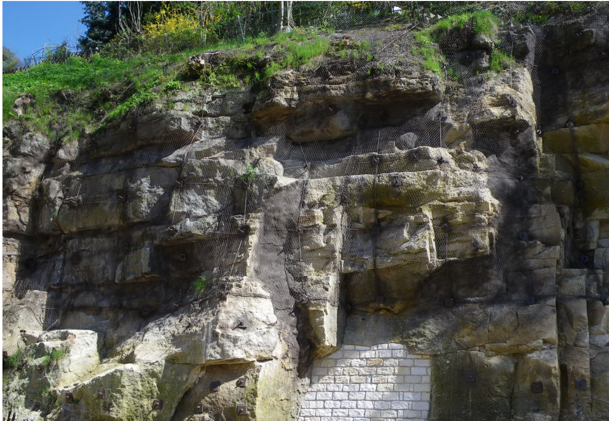
Bild 5. Ansicht eines farblich an die Umgebung angepassten, verseilten Steinschlagschutznetzes