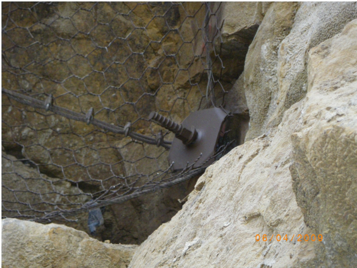
Bild 6. Detailansicht eines farblich an die Umgebung angepassten, verseilten Steinschlagschutznetzes sowie der notwendigen Systemkomponenten der Felsnägel